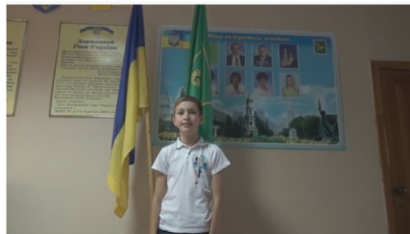
Я маю право. Проект "WORLDWIDE CHILDREN".

Для учнів 8-х класів проводились заняття за Програмою виховної роботи з питань протидії торгівлі людьми «Особиста гідність. Безпека життя. Громадянська позиція».