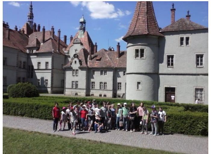
Експерсії малювничими куточками