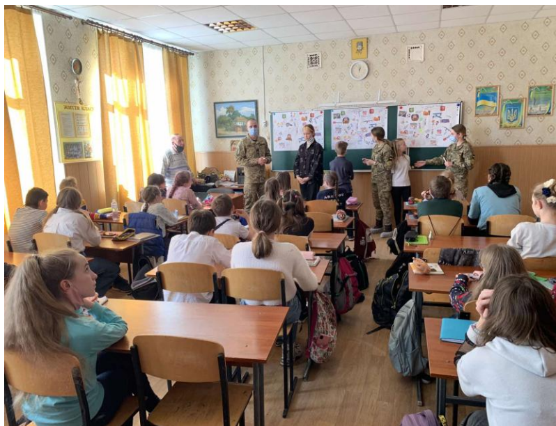
Зустріч з військовими