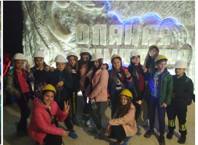
Подорож до Соледару